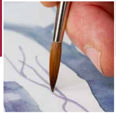
Besonders fein ausgeformte Spitze Extraordinary fine tip Pointe effilée Punta estremamente fina