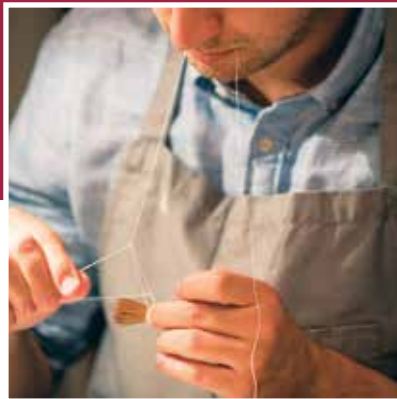
Per Hand hergestellt Made by hand Fabriqué à la main Prodotti a mano