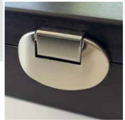
Hochwertiger Schatullenverschluss High-quality box closure Fermeture de boîte de haute qualité Chiusura del cofanetto di alta qualità