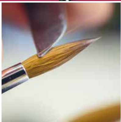
Hochwertige Linie für Aquarellmalerei Exquisite line for watercolour painting La ligne de haute qualité pour l'aquarelle La linea di alta qualità per l'acquarello