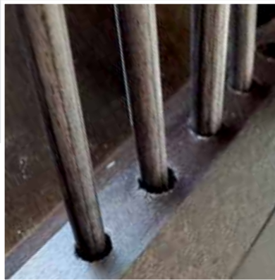
Integrierte Pinsel-Halter Integrated brush holder Support pour pinceaux intégré Supporto integrato per i pennelli